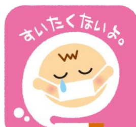
受動喫煙防止シンボルマーク

受動喫煙の影響 http://www.jstc.or.jp/uploads/uploads/files/KINENGAJU2013.pdf